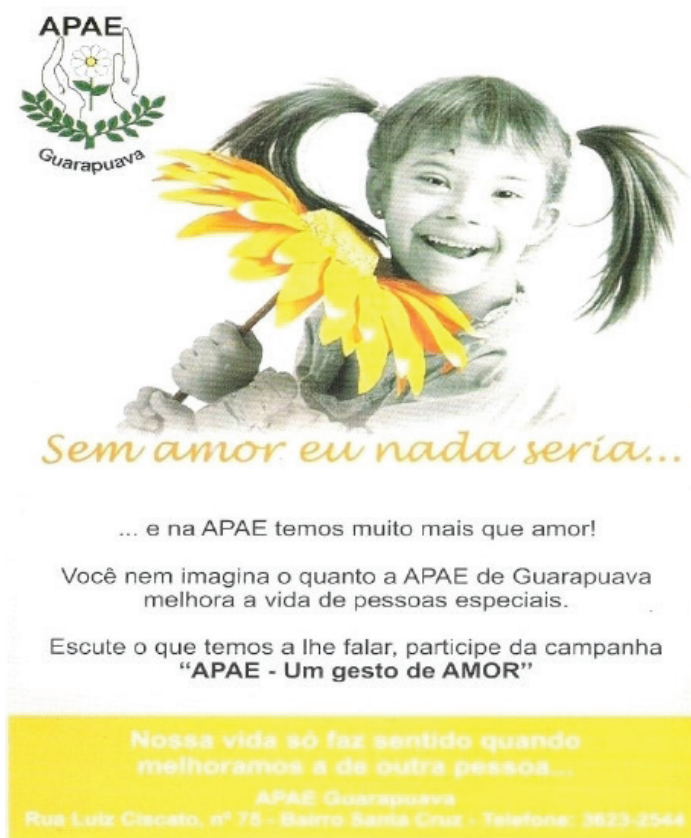
Figura 6: PP central de arrecadação de recursos.

Ao afirmar que, na APAE, oferece-se mais do que amor, ficam implícitas as outras importantes ações, mas estas não são reveladas, prevalecendo a manutenção de uma posição sócio-ideológica de total dependência e subordinação aos cuidados da escola especial. Ocorre aqui um entrecruzamento com a produção de discursos que pareciam já estar superados, mas que a necessidade de arrecadação de fundos fez rememorar, fazendo, assim, coexistirem discursos divergentes sobre a concepção da deficiência na atualidade.